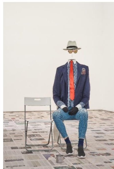
Copyright: 'Headless Man', Claire Fontaine, 2016.

De fictieve kunstenaar Claire Fontaine levert in haar sculpturen, schilderkunst, video en teksten kritiek op 'productie' binnen het kapitalistisch systeem, die vaak afgedaan wordt als 'creatie'. Ze ontleent haar naam aan Marcel Duchamps' iconische ready-made – het urinoir met als Franse titel Fontaine – en aan het gelijknamige Franse papierwarenmerk. Claire Fontaine gebruikt het concept van expropriation van objecten – readymades – als een manier om een existentiële gebruikswaarde te geven aan reeds bestaande objecten en kunstwerken. In haar programmatische oeuvre is politieke machteloosheid vaak een thema. 'Headless Man' is een 'performing object'. Geïnspireerd door straatartiesten op toeristische plekken, portretteert 'Headless Man' een creatieve bedelaar die zichzelf objectificeert om opgemerkt te worden, zijn eigen menselijkheid uitwist en zich in een hoofdloos 'ding' transformeert.