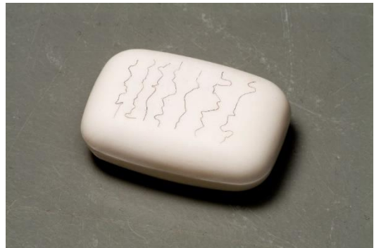
Copyright: ‘Short Sad Text (Based on the borders of Two Countries)’, Oksana Pasaiko, Sit. Oct.22, 1949. Collection S.M.A.K., Stedelijk Museum voor Actuele Kunst, Gent.

“Overeenkomstig de wensen van de kunstenaar worden er geen details gepubliceerd over haar leven”, staat er over Oksana Pasaiko geschreven in de catalogus van Manifesta 5 in San Sebastian in 2004. Uitzonderlijk wordt vermeld dat de kunstenaar in 1982 werd geboren in ‘Ruthenia’: geen officiële staat maar een historische landstreek in Oost-Europa, tussen Polen, Hongarije, Slowakije, Roemenië en Oekraïne. Dat suggereert dat de kunstenaar meer belang hecht aan haar etniciteit dan haar nationaliteit. Het werk ‘Short Sad Tekst (Based on the Borders of Two Countries)’ uit 2005 bestaat uit een stuk zeep waarop zeven zwarte menselijke haren werden gelegd in het patroon van zeven door mensen bevochten landsgrenzen. Aan haar werk uit 2005 heeft Pasaiko nog eens zeven stukken zeep toegevoegd: een noodzaak omwille van de troebele politieke actualiteit op het wereldtoneel vandaag.