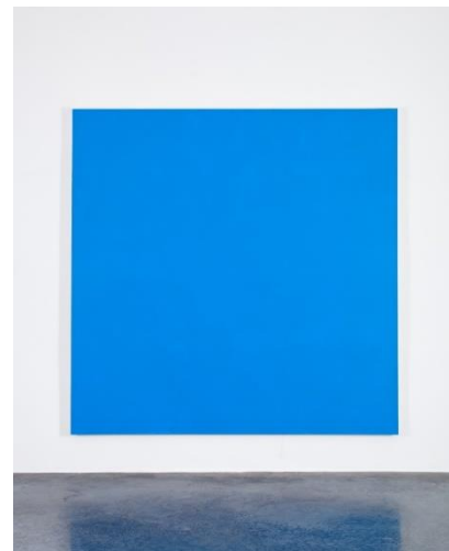
Copyright: 'Racer Car', Henry Codax, 2012. Courtesy of Office Baroque. Photo credit: Koen De Wael

De fictieve kunstenaar Henry Codax begint vanaf 2011 monochrome schilderijen van identieke afmetingen tentoon te stellen in gerenommeerde kunstgaleries in New York, Los Angeles en Zwitserland. Codax past perfect binnen het plaatje van alles wat de hedendaagse kunstwereld verlangt van zijn 'professionele' kunstenaars. Behalve dan dat er geen echte Henry Codax is. Hij bestaat slechts als een karikatuur van een Amerikaanse monochrome schilder – stil, radicaal, berekenend en viriel. Hij werd als een cadavre exquis samengesteld in de roman 'Reena Spaulings' (2004) door het anonieme kunstenaarscollectief Bernadette Corporation. Het collectief nam een quasi-bedrijfsidentiteit aan om kritiek te uiten op een mondiale cultuur die identiteit construeert door middel van consumptie en branding .