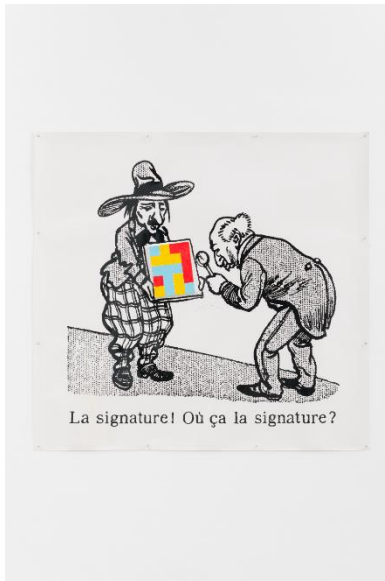
Copyright: 'La signature! Où ça la signature?', Ernest T., 1990

De bezieler van de fictieve kunstenaar Ernest T. werd in België geboren. Hij ontleent zijn naam aan een Amerikaanse comic, en kan zo in alle anonimiteit opereren. Zijn oeuvre, waarin hij onder meer de waarde van een signatuur bevraagt, leest als een visuele verderzetting van zijn naamsverzwijging. In zijn reeks Peintures nulles – waar 'La signature! Où ça la signature?' toe behoort – is zijn naam alomtegenwoordig. Zo zijn deze schilderijen samengesteld uit letters T die als een puzzel in elkaar zijn geschoven: tegelijkertijd zijn signatuur en zijn signatuurschilderstijl.